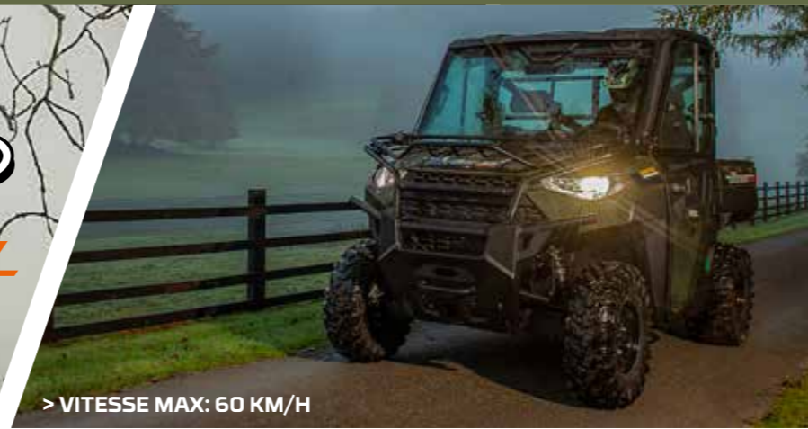
> VITESSE MAX: 60 KM/H