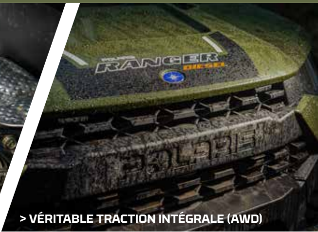
> VÉRITABLE TRACTION INTÉGRALE (AWD)