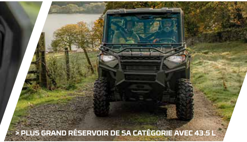
> PLUS GRAND RÉSERVOIR DE SA CATÉGORIE AVEC 43.5 L