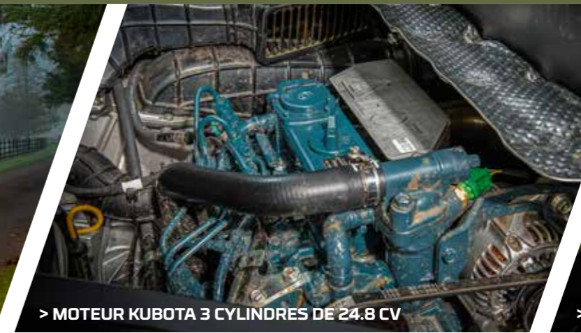
> MOTEUR KUBOTA 3 CYLINDRES DE 24.8 CV