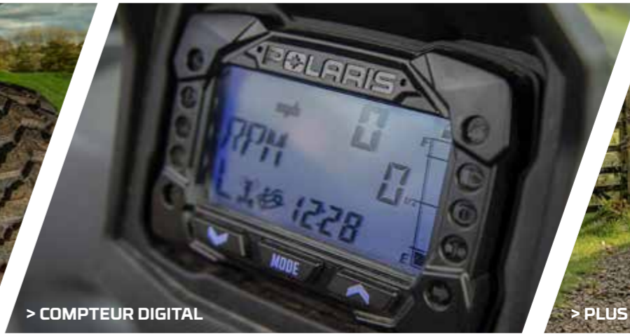
> COMPTEUR DIGITAL