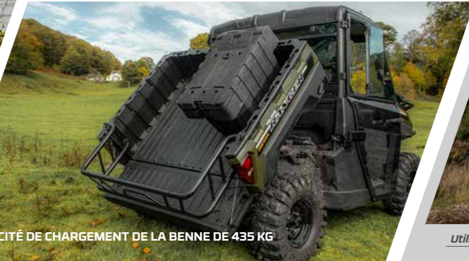
> CAPACITÉ DE CHARGEMENT DE LA BENNE DE 435 KG