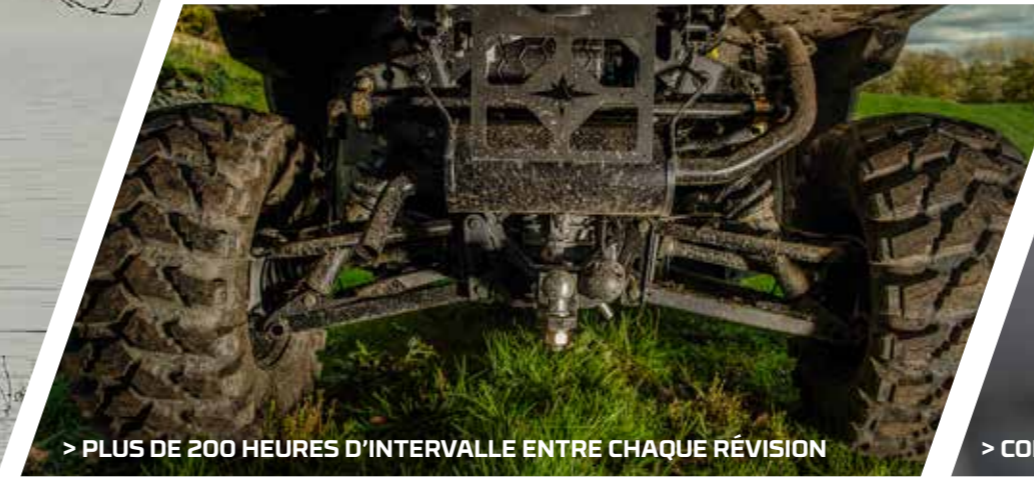
> PLUS DE 200 HEURES D'INTERVALLE ENTRE CHAQUE RÉVISION